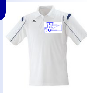
De nieuwe clubkleding